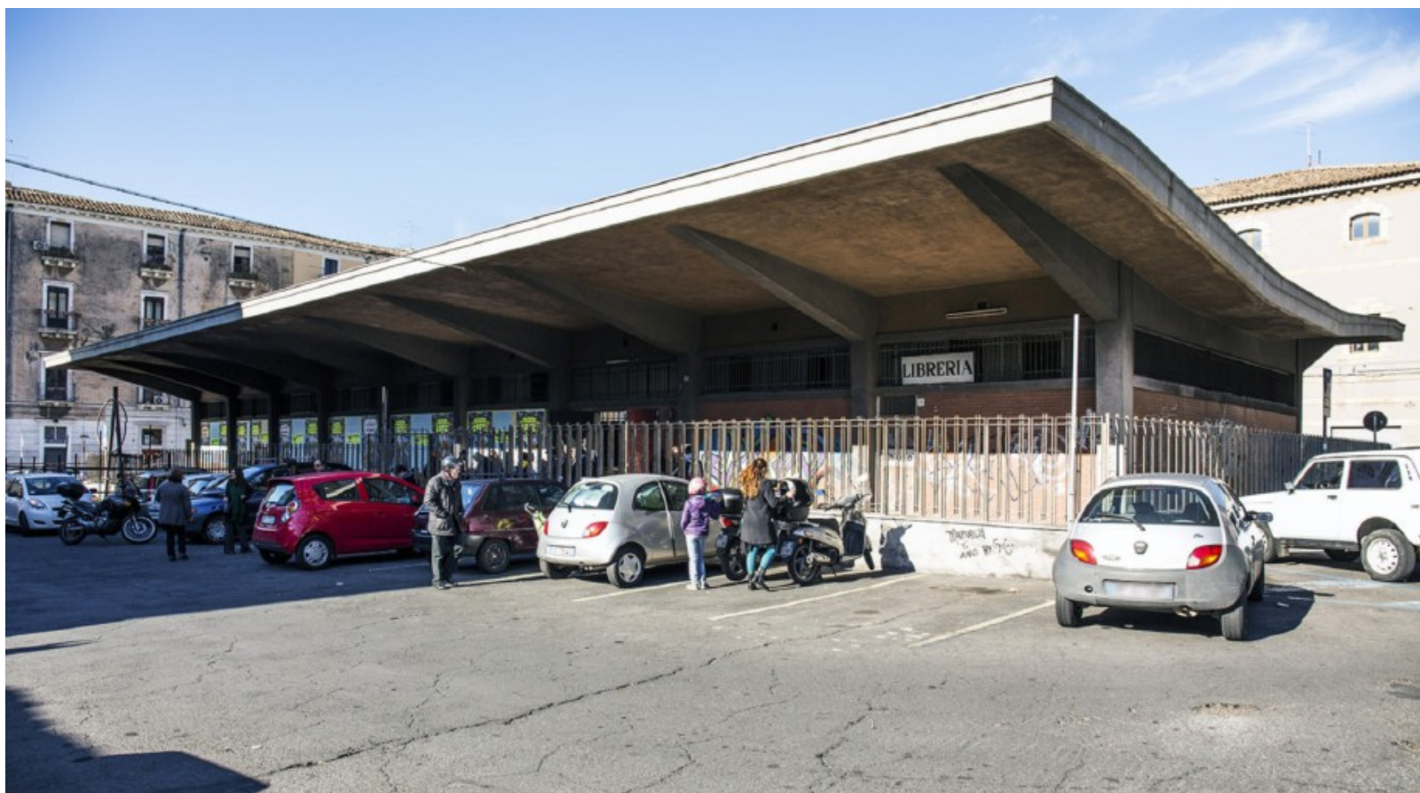
LA PALESTRA DI PIAZZA PIETRO LUPO È AL CENTRO DI UN CASO DAVVERO INTRIGATO

Ritorna dunque in auge l'ipotesi del progetto di finanza